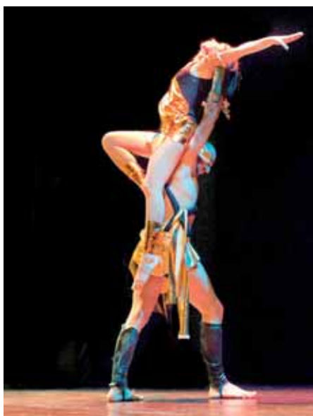
Passaggio a due di una coreografia di Danza Moderna

Chi desidera un allenamento più intenso, per eliminare i chili di troppo, ma anche per tonificarsi, c'è il Total Body Funzionale , uno dei metodi di allenamento oggi più in voga. Maggior forza, potenza e flessibilità, ma anche equilibrio, velocità e resistenza sono assicurati con questo tipo di training, che lavora sul fisico a 360°, migliorandone le capacità e le performance.