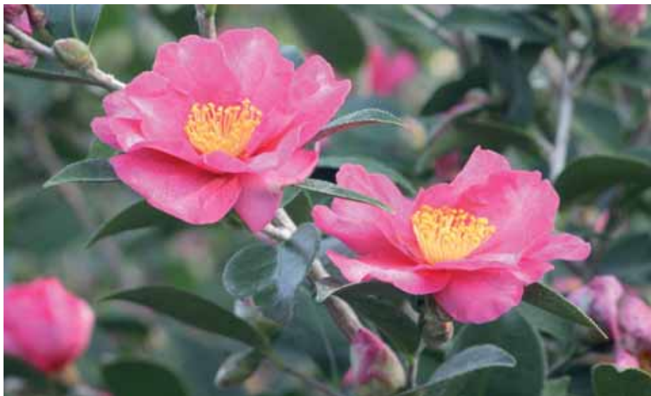
Un esemplare di Camelia Sasanqua

“Il coinvolgimento di periodici diffusi in tutta Italia (e non solo) e affermati in vari settori – fa sapere il Centro Culturale Compitese –, da quello del giardinaggio al turismo , dall' ambiente al costume , centra in pieno l'obiettivo che sta alla base del progetto “Ppf”, da noi ideato. Ci riferiamo alla possibilità di raggiungere tramite articoli, immagini e reportage realizzati dai nostri ospiti, un alto numero di soggetti appartenenti ai più disparati target. Sappiamo infatti che il nostro territorio è ricco di risorse e potenzialità, in grado di interessare chi ama la vita open air, ma anche i cultori dell'enogastronomia, così come gli appassionati dal pollice verde. Far conoscere le celebri manifestazioni annuali, come la Mostra “Antiche Camelie della Lucchesia” , la bellezza di luoghi e