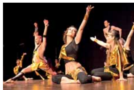
Coreografia di Danza Moderna

Per chi ama l'attività fisica, ma è alla ricerca di un mood più tranquillo e rilassato, c'è il corso di Aerobica Dolce . Si tratta di esercizi di ginnastica a corpo libero eseguiti a ritmo di musica. Non ci sono limiti di età per praticare questo tipo di attività, che garantisce soddisfacenti traguardi in termini di elasticità, resistenza, benessere fisico e perdita di peso. I corsi si svolgeranno dal mese di ottobre fino a maggio 2017 , sia al matino che al pomeriggio , a Guamo, presso la sede dell'Associazione. Per avere informazioni più dettagliate è possibile